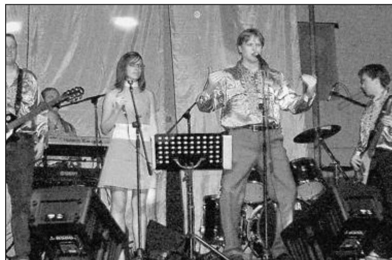
Le groupe enghiennois Awissa connaît son petit succès dans la région. Leurs concerts sont un pur moment de folie.