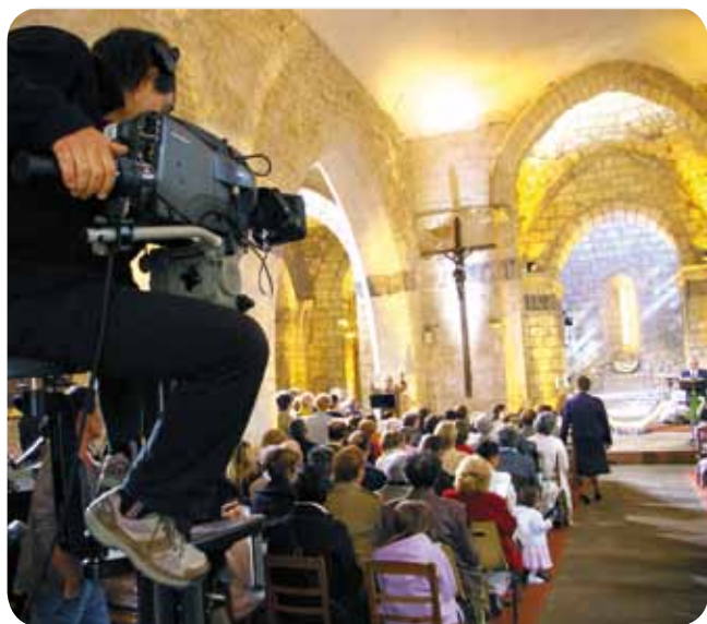
Retransmission d'une messe TV