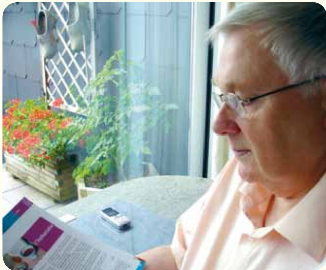
Dernière relecture d'Église de Liège par Gilbert Muytjens.