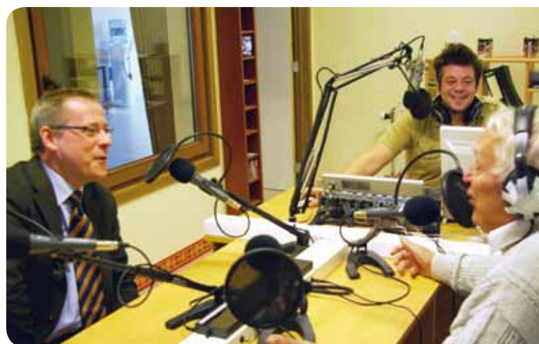
Les studios de Namur