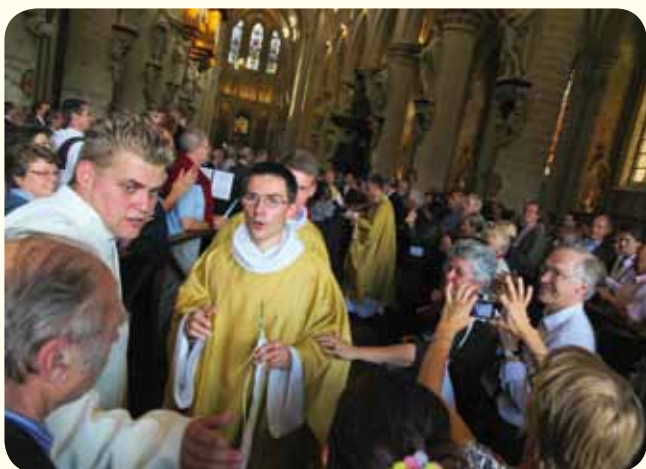
Ordination diocésaine en septembre 2009.

DIMANCHE DES MÉDIAS 26.09.2010 COMMUNIQUER POUR CROIRE CROIRE POUR COMMUNIQUER