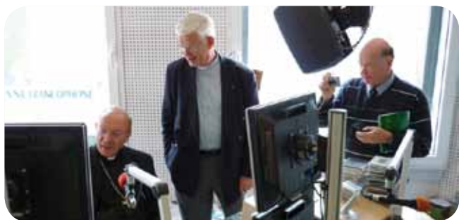
Mgr Léonard en visite dans les studios de RCF Bruxelles.