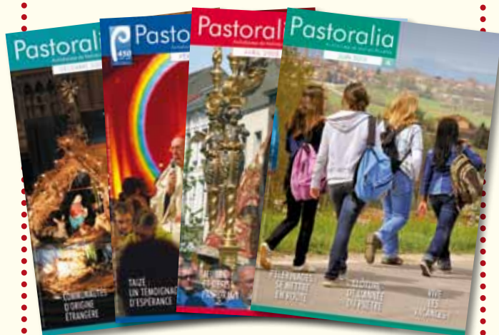
Pastoralia, la revue de l'Archidiocèse de Malines-Bruxelles.

La revue du diocèse est un mensuel de 32 pages en couleurs, tiré à 3300 exemplaires et distribué aux abonnés, à tous les « nommés » du diocèse (prêtres, diacres, laïcs et religieux) et à l'ensemble des professeurs de religion. Pour chaque numéro, vous trouverez : un éditorial de l'archevêque, des nouvelles du diocèse, des articles de réflexion ainsi que les annonces et Personalia du mois.