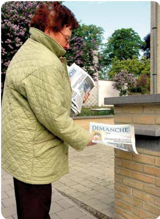
Dimanche, une vocation missionnaire